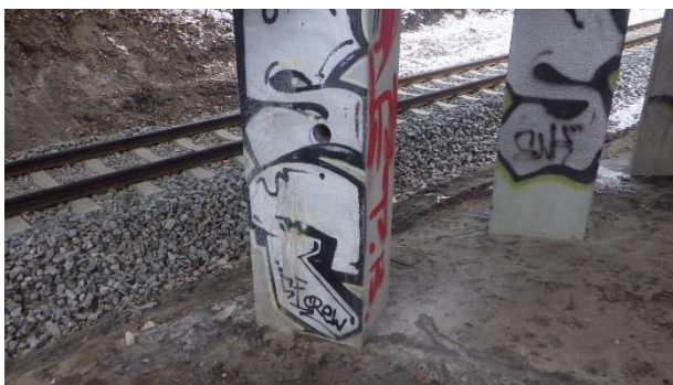
Foto 6.3.1 Pohled na provedené místo jádrového vývrtu Ø75 mm s označením V-03 odebraného z boční stěny 2. sloupu pilíře P2 zleva