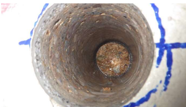
Foto 6.7.3 Detailní pohled do ostění po vyjmutí provedeného jádrového vývrtu s označením V-07