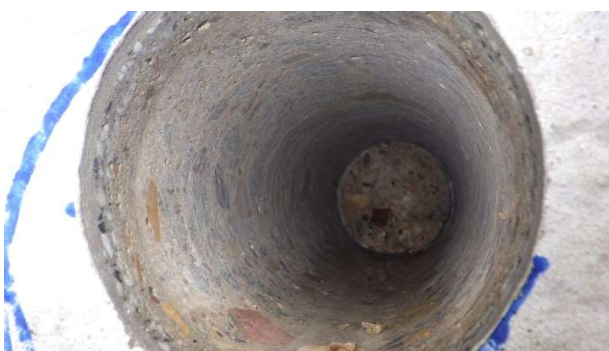
Foto 6.3.3 Detailní pohled do ostění po vyjmutí provedeného jádrového vývrtu s označením V-03