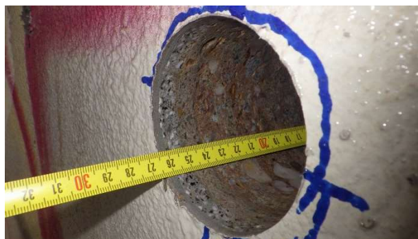
Foto 6.7.2 Měření celkové hloubky provedeného jádrového vývrtu Ø 75 mm s označením V-07 odebraného z bočního líce 1. trámu zleva v poli 3