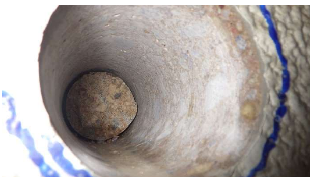
Foto 6.8.3 Detailní pohled do ostění po vyjmutí provedeného jádrového vývrtu s označením V-08