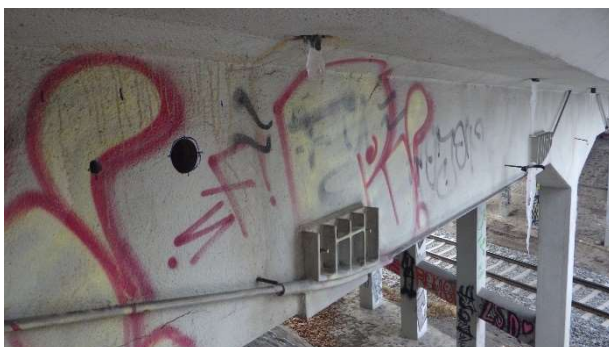
Foto 6.7.1 Pohled na provedené místo jádrového vývrtu Ø 75 mm s označením V-07 odebraného z bočního líce 1. trámu zleva v poli 3