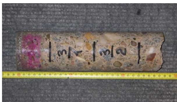
Foto 6.3.4 Laboratorní foto vzorku s označením V-03 včetně provedeného testu hloubky karbonatace a s vyznačenou polohou zkušebních těles