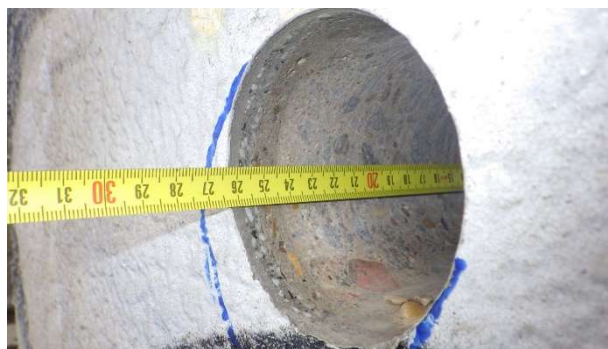
Foto 6.3.2 Měření celkové hloubky provedeného jádrového vývrtu Ø75 mm s označením V-03 odebraného z boční stěny 2. sloupu pilíře P2 zleva