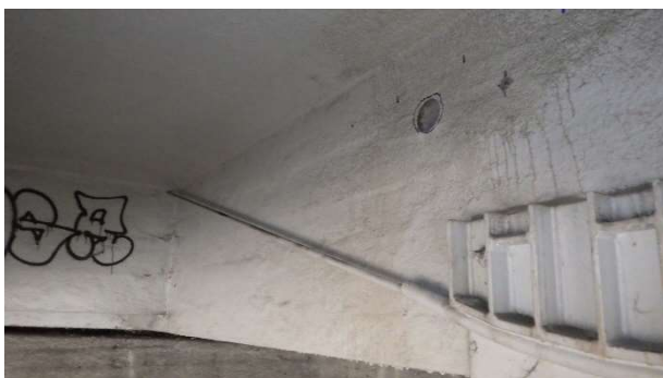
Foto 6.8.1 Pohled na provedené místo jádrového vývrtu Ø75 mm s označením V-08 odebraného z bočního líce 4. trámu zleva v poli 3