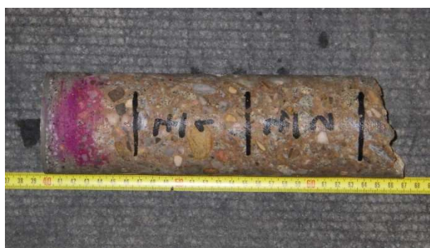
Foto 6.7.4 Laboratorní foto vzorku s označením V-07 včetně provedeného testu hloubky karbonatace a s vyznačenou polohou zkušebních těles