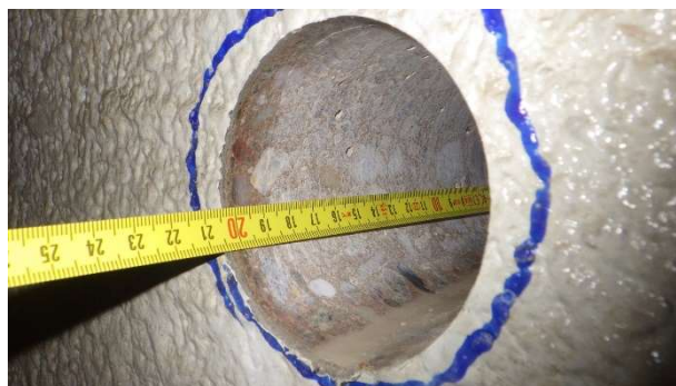
Foto 6.8.2 Měření celkové hloubky provedeného jádrového vývrtu Ø75 mm s označením V-08 odebraného z bočního líce 4. trámu zleva v poli 3