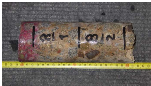
Foto 6.8.4 Laboratorní foto vzorku s označením V-08 včetně provedeného testu hloubky karbonatace a s vyznačenou polohou zkušebních těles